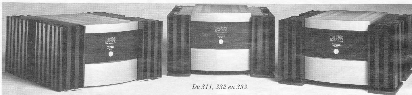
De 311, 332 en 333.

scheiden mening Krell-liefhebbers op zijn minst in vertwijfeling zal brengen. De 331, 332 en 333 lijken klankmatig erg op elkaar. De famulietrekken zijn onmiskenbaar. Met omvang en vermogen lopen ook de grootte van het klankbeeld, de autoriteit en het gemak op, maar dat spreekt eigenlijk vanzelf. De echte grote verschillen komen pas naar voren bij veeleisende, hele grote systemen als de veel stroom vragende Avalon Radian HC of magnetostaten met lastige impedanties. In deze situatie is de 331 meer dan goed genoeg. De SL-3 klimt nog wel mee bij de twee grotere broers maar prijs-kwaliteitsmatig is het onzin veel verder te gaan dan de 331 die in wezen met zijn 200 watt aan 4 Ohm (de nominale impedantie van de SL-3) al het optimale vermogen biedt.